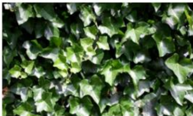
Lierre Hedera Helix Ibernica