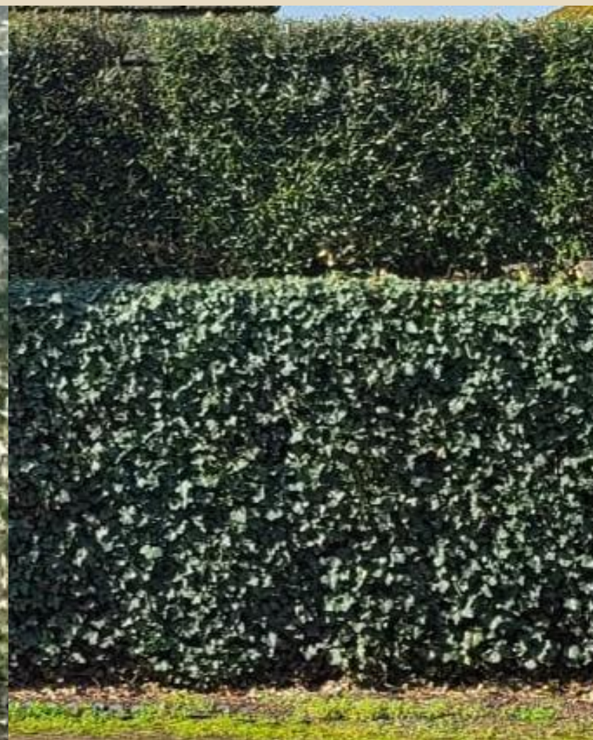
6 mois après l'installation