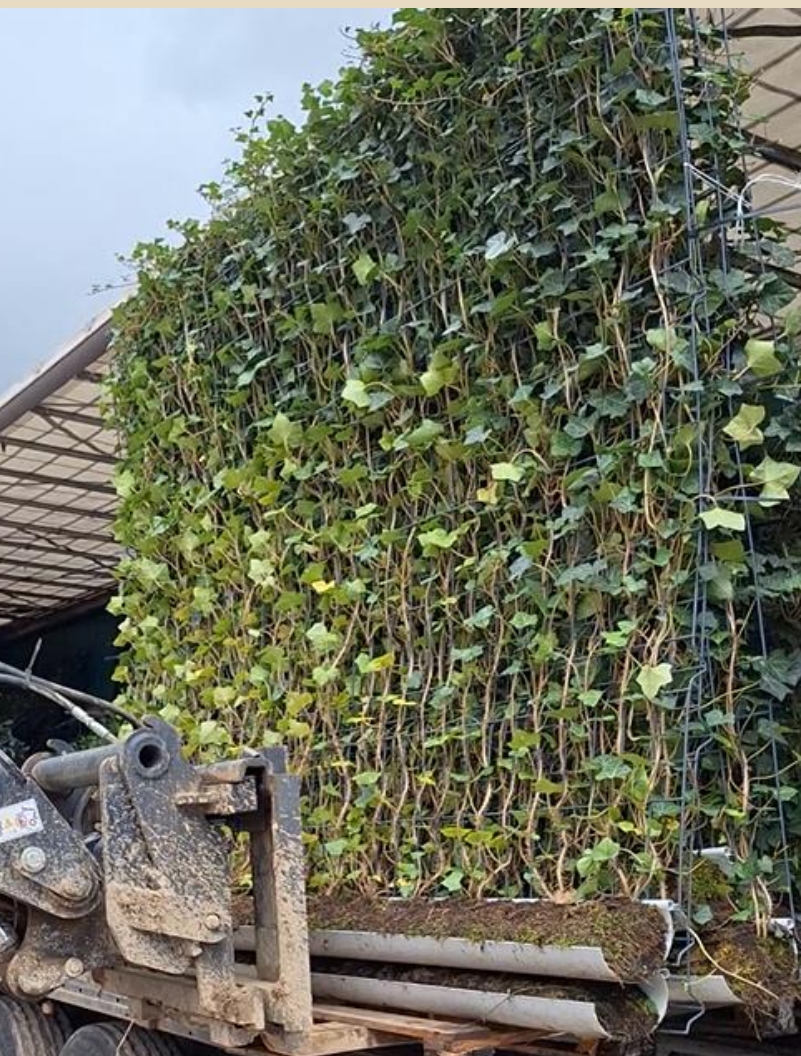
à la livraison